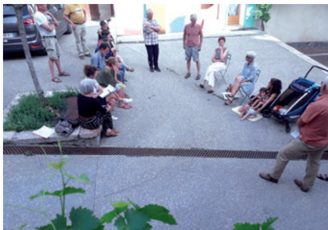
RÉUNION DU QUARTIER DU CENTRE-VILLE DE JUIN 2022