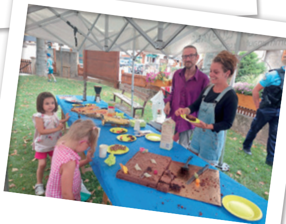
UN GOÛTER EN PARTENARIAT AVEC L'ASSOCIATION ECHOO POUR FÊTER LA MUSIQUE