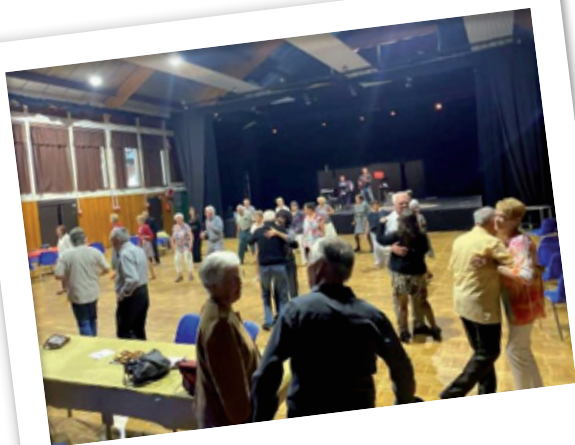
THÉ DANSANT OFFERT PAR LA COMMUNE LE 15 MAI