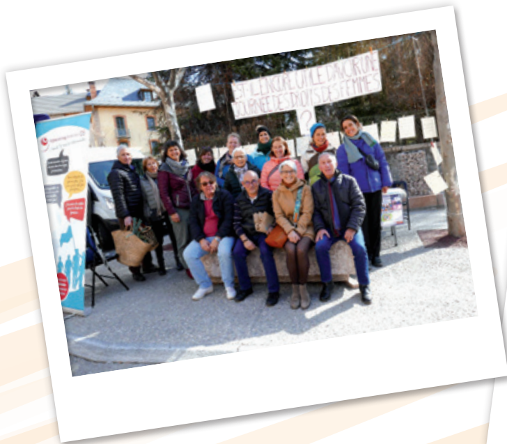
JOURNÉE DES DROITS DE LA FEMME AU MARCHÉ DE GUILLESTRE AVEC DES ÉLUS