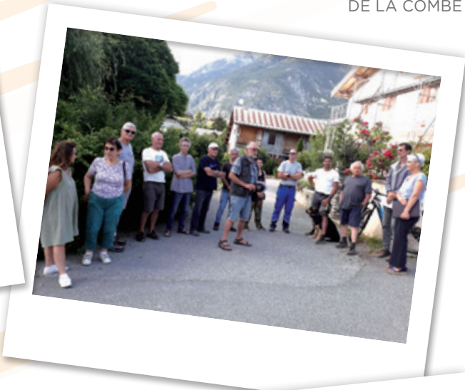
RÉUNION DU QUARTIER DE LA COMBE