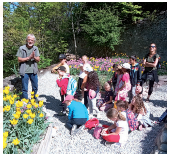
VISITE À LA MAISON DE LA NATURE POUR LA FLORAISON DE LA TULIPE DE GUILLESTRE

Renseignements auprès du Service Jeunesse : 07 85 01 47 76 ou 06 12 33 28 92