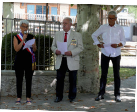
COMMÉMORATION DE L'APPEL DU 18 JUIN À LA PLANTATION AVEC LES ASSOCIATIONS D'ANCIENS COMBATTANTS