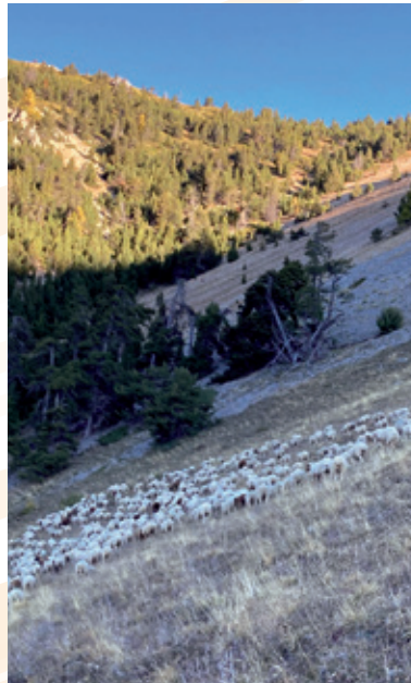
LE TROUPEAU EN PÂTURE

Sur près de 1500 ha, quelques 1200 ovins (brebis et agneaux) et 250 bovins (vaches, génisses et veaux) pâturent durant 4 mois entre juin et octobre.