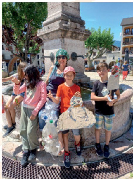
LES FANTÔMES DE DÉCHETS

En parcourant les rues de Guillestre, guidés par une chasse aux déchets ludique concoctée par l'association Pics et Colegram , les participants ont ramassé de nombreux débris. Une partie d'entre eux ont servi à réaliser des œuvres sur le thème « des revenants » choisi par les enfants : « Ces déchets qui ont été abandonnés dans la nature, qui errent en attendant d'être triés, et qui reviennent nous hanter pour qu'on les jette finalement dans la bonne poubelle ! ».