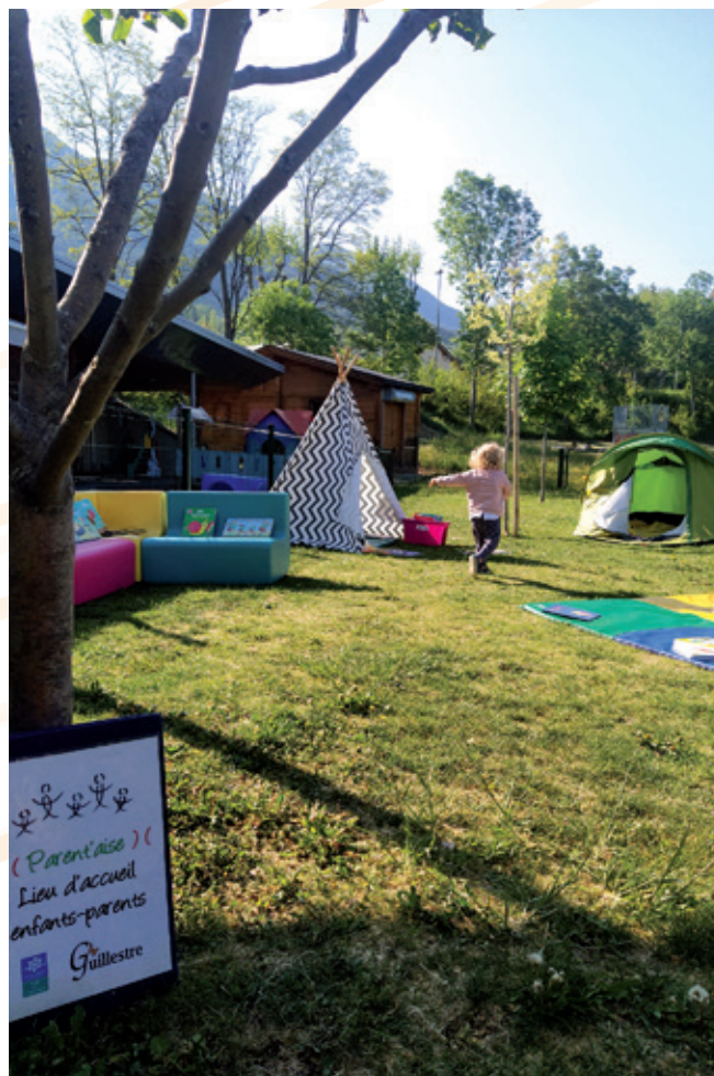
ATELIER MOTRICITÉ EN PLEIN AIR

Renseignements auprès du Service Jeunesse : 07 85 01 47 76 / jeunesse@villedeguillestre.fr