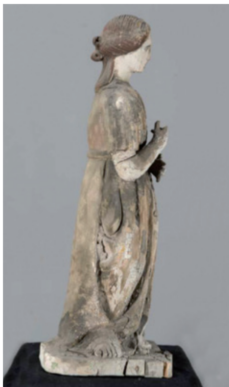
LA STATUE D'ORIGINE DE SAINTE CATHERINE

À la fin du XIV e siècle, l'archevêque d'Embrun décide du tracé des remparts destinés à défendre la ville des incursions ennemies et ferme ainsi l'accès à l'Est par la Porte du Queyras ou Porte Ste Catherine. À l'origine, cette porte était surmontée d'une niche fermée par une grille en fer forgé abritant une statue en bois sculptée et peinte datant du Moyen-Âge (environ 1480).