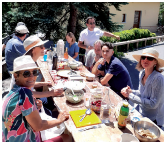
REPAS DES VOISINS DU QUARTIER DES CHAPELLES DE JUIN 2022

Alors n'hésitez pas à répondre favorablement à la sollicitation de vos responsables de quartiers !