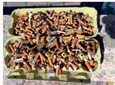
700 MÉGOTS RAMASSÉS EN 1H EN VILLE

Au niveau mondial on estime qu'à chaque seconde 137 000 sont jetés par terre.