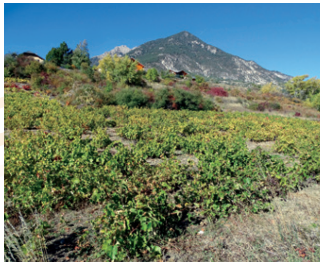
SUR LES CÔTEAUX DE CHAMP CHEVALLIER