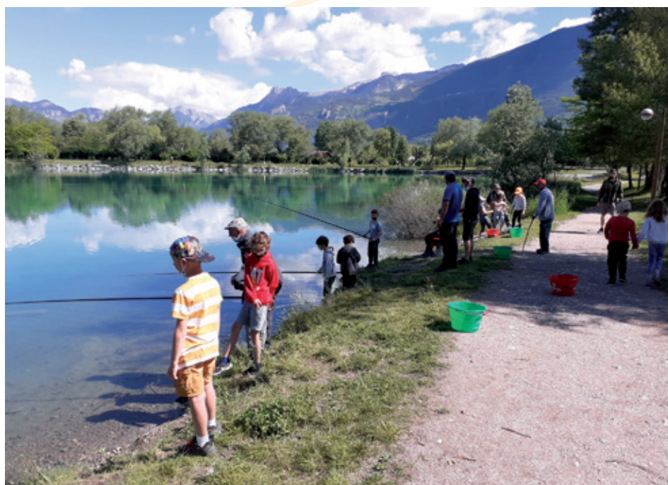
ANIMATION PÊCHE AU LAC D'EYGLIERS AUPRÈS DES JEUNES