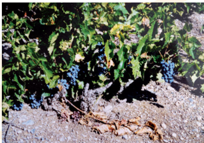
DES VIGNES PRODUCTIVES

En 2022, ils ne sont plus que trois à entretenir des parcelles de vigne contre une trentaine dans les années 70. On y comptait même des varsincs et des ceillaquins qui possédaient en plus des terres un cellier (petit local dans le centre du village où l'on pouvait dormir et y entreposer les cuves) souvent dans le quartier de la Frairie.