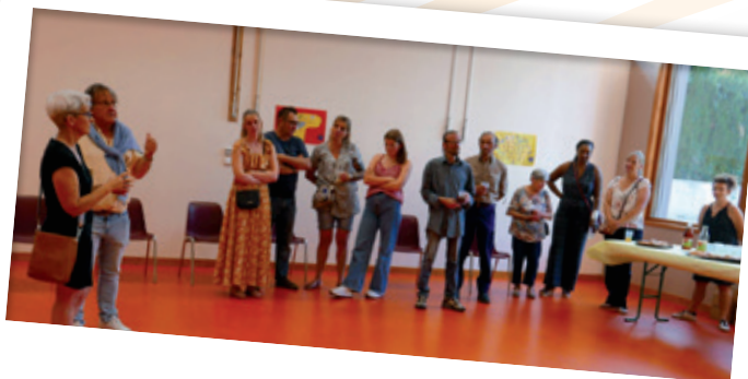
CÉRÉMONIE DE REMERCIEMENTS AUX DIVERS BÉNÉVOLES DE LA COMMUNE